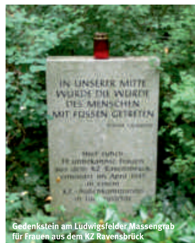
Gedenkstein am Ludwigsfelder Massengrab für Frauen aus dem KZ Ravensbrück